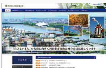
四日市市自治会連合会 ホームページQRコード